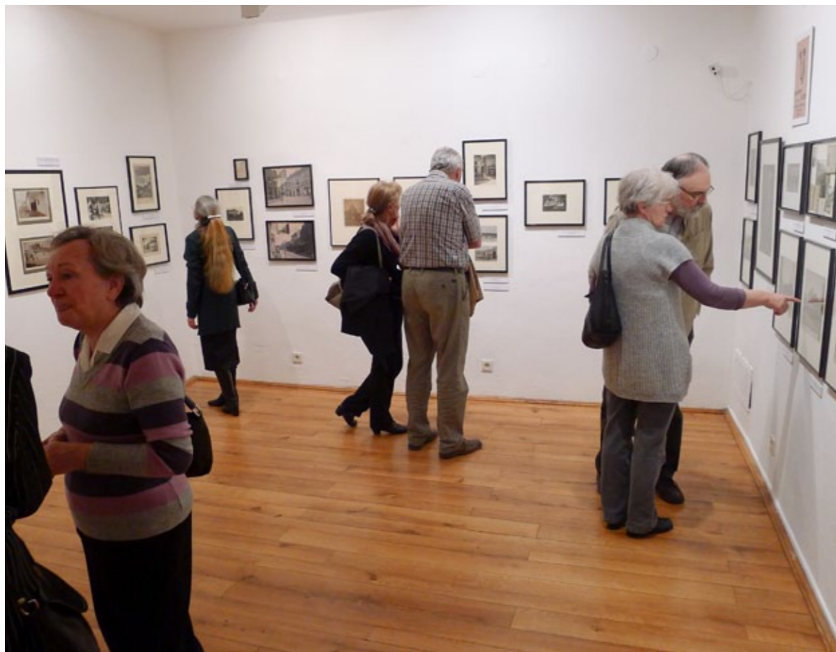
Az Emlékmentés kiállítás megnyitója

VÁROSI KÉPTÁR – DEÁK GYŰJTEMÉNY 8000 Székesfehérvár, Oskola u. 2-4.