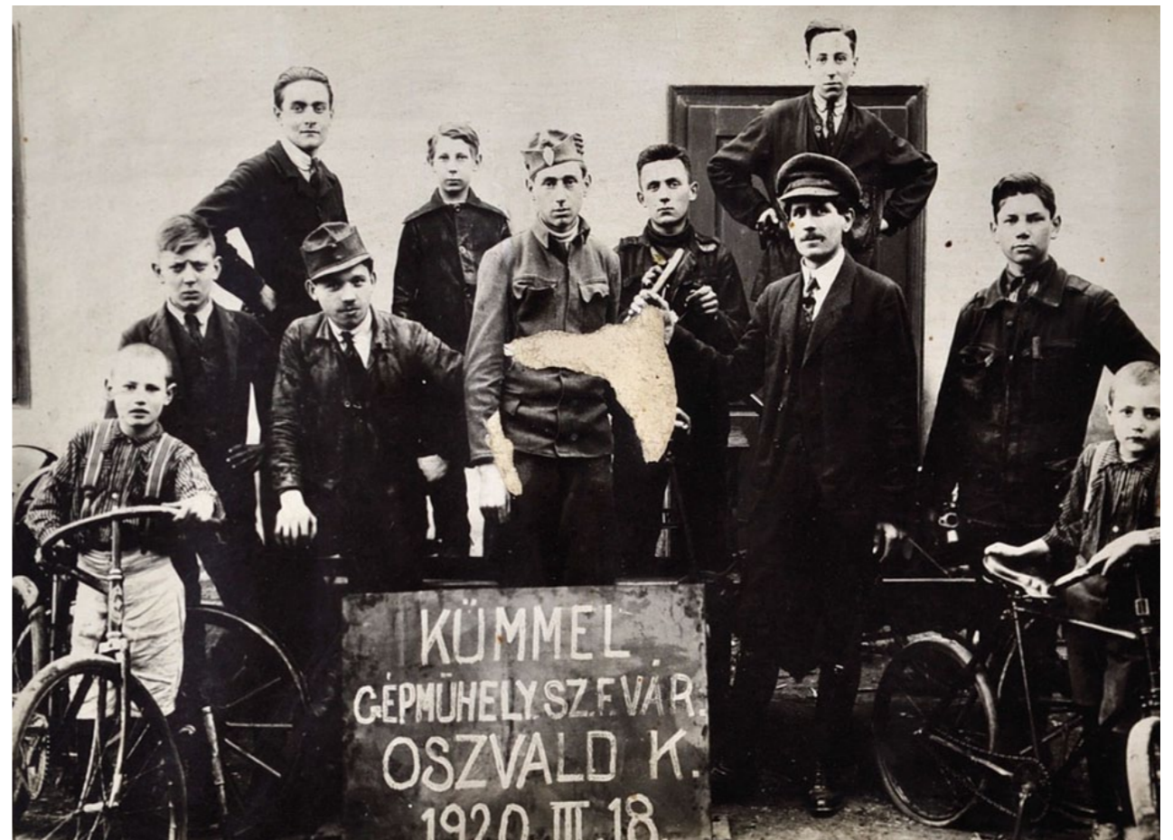
Csoportkép, 1920

2013. február 12-étől, ingyenes tárlatvezetéseket tartunk, külön-külön az egyes szakmák (orvosok, városvédők, ügyvédek, művészek, kereskedők, iparosok) képviselői számára.