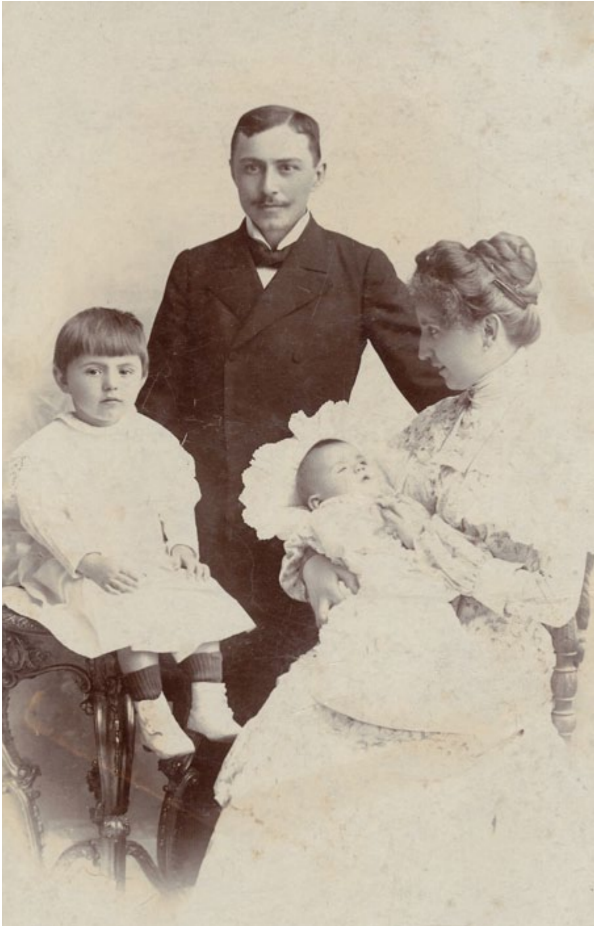
Családi fotó, 1890 körül