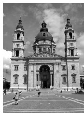
SZENT ISTVÁN BAZILIKA