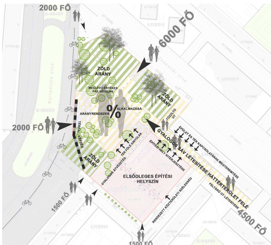
A kerületi szabályozási terv fő koncepcionális elemei

A ötletpályázat eredményeinek felhasználásával az Önkormányzat új szabályozási tervet (KSZT) fogadott el, melyben a tér megfelelő jogi státusza rendezésre került, meghatározásra kerültek az építési helyek, előírásra kerültek a flexibilis téralakítás kööttségei, a meglévő növényzet figyelembevétele. A hatályos KSZT-t, valamint annak alátámasztó munkarészeit a kiírás melléklete tartalmazza. A KSZT szerint a tér közterületből telekké, azaz az új művelődési ház "kertjévé" válik. A telek kialakításának földhivatali eljárása folyamatban van. A téren meglévő, 91158/32 hrsz-ú ingatlanon álló, felújított élelmiszer áruház megtartandó, a KSZT-ben biztosított fejlesztési lehetősége a tervezés során figyelembe veendő. A Fő tér kialakuló új telkén a buszmegálló közelében található meglévő pavilonok, továbbá az áruház melletti cukrászda, a meglévő kultúrház nem megtartandó elemek.